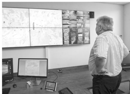
PŘI OBHLÍDCE dispečinku společnosti Ostravské komunikace.