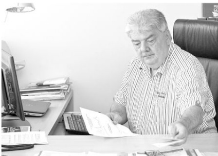
ÚRADUJE také v sídle firmy Vítkovice Machinery Group.