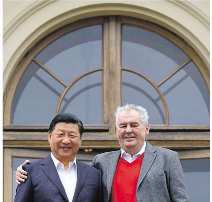
Vděčná Čína Čínský prezident Si Ťin-pching vnímá Miloše Zemana jako spojence.

Čína se stala členem Světové obchodní organizace (WTO) v prosinci 2001, kdy na patnáct let přijala status netržní ekonomiky. Toto období v posledním měsíci letošního roku končí a WTO musí do 11. prosince rozhodnout, zda Číně udělí status tržní ekonomiky. Její zboží by se tak dostávalo snadněji na evropský trh, z čehož ale mají mnohé země EU obavy.