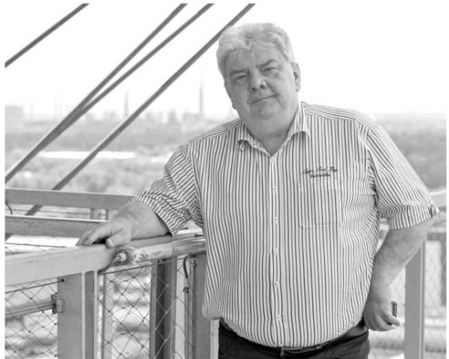
V DOLNÍ OBLASTI VÍTKOVIC na Bolt Toweru měl pracovní schůzku.