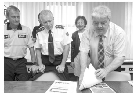
NA HEJTMANSTVÍ měl jednání bezpečnostní rady kraje.